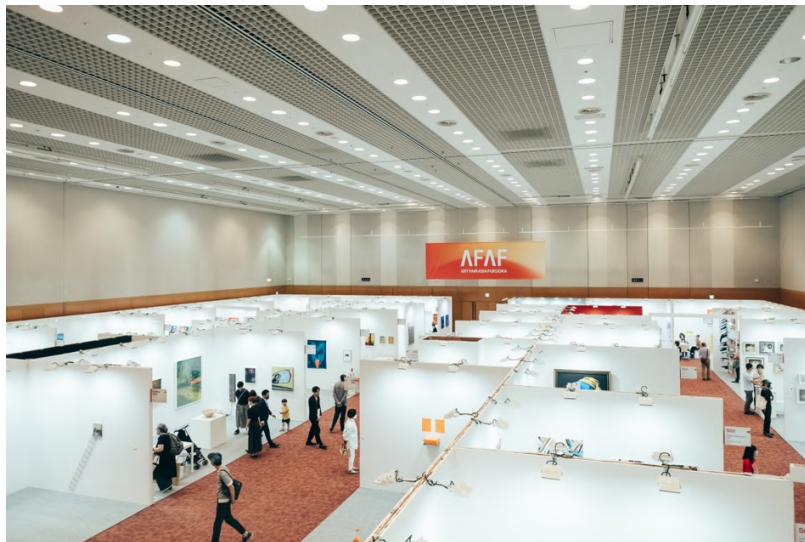
「アートフェアアジア福岡 2022」会場の様子

AFAF2023 は、「ASIA」、「Unlimited」、新設の「The Wall」の3つのセクションで構成されます。