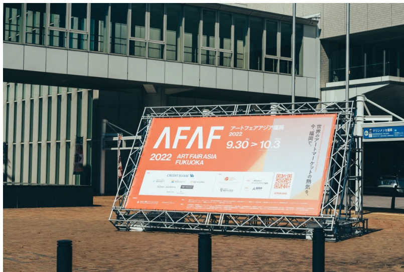
「アートフェアアジア福岡 2022」会場の様子