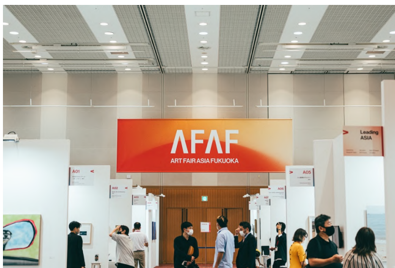
「アートフェアアジア福岡 2022」会場の様子

ギャラリーによるブースのほか、昨年に引き続き本年もアジアをコンセプトとしたキュレーションブースや、異業種・他地域とのコラボレーションブースを設け、産官学の垣根を超え一体となり、アジアのアートマーケットの発展に貢献してまいります。