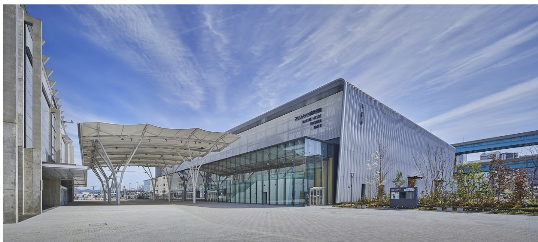
会場となるマリンメッセ福岡 B 館外観

AFAF2023 は マリンメッセ福岡 B 館 での初開催となり、昨年に比べ約 4 倍となる約 5,000 平米の広さを活かし、 アートの魅力と熱気が一つの会場に集約したアートフェア を展開いたします。